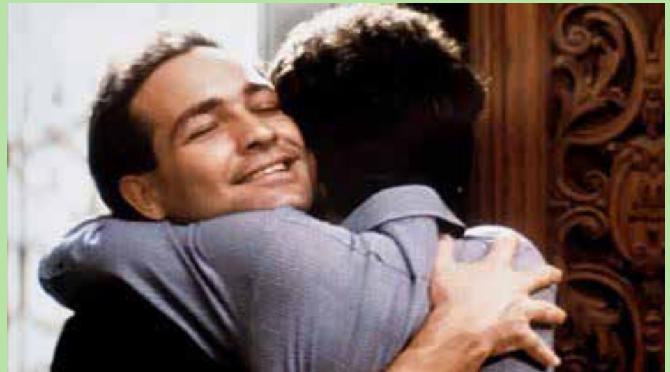
Jorge Perugorría y Vladimir Cruz en Fresa y Chocolate.

El Primer Secretario del Partido Comunista de Cuba y Presidente de la República, Miguel Díaz-Canel Bermúdez, publicó en su cuenta en X: “Felicidades al respetado y querido Jorge Perugorría por el muy merecido Premio Nacional de Cine. Su nombre y su obra son sinónimos de cine cubano”.