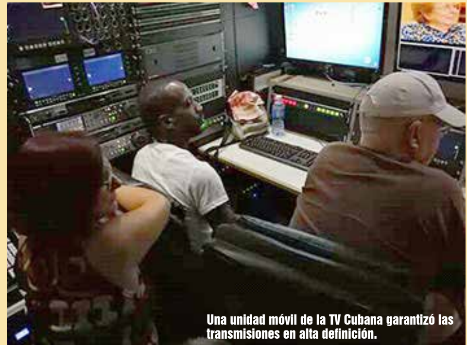
Una unidad móvil de la TV Cubana garantizó las transmisiones en alta definición.

su intervención este año, el presidente Miguel Díaz-Canel Bermúdez, quien insiste continuamente en el hecho de que todos los cubanos y la Revolución representamos continuidad histórica, de ahí la relevancia de afianzar la unidad nacional y pensar como país.