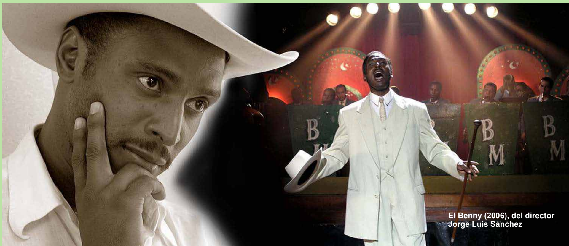
El Benny (2006), del director Jorge Luis Sánchez

Nuestra televisión de servicio público que se dirige al ciudadano mantiene una esencia integradora de lo cultural, lo educativo, en el sentido de reconocer lo genuino y activar las inteligencias lectoras desde edades tempranas. La consulta de fuentes ha tenido una apertura con la llegada de Internet y la aparición de bibliotecas digitales, que no responden siempre a contextos socio-históricos y culturales, épocas, estilos, tendencias o biografías de los compositores e intérpretes más relevantes. Completar y enriquecer desde nuestros enfoques esos contenidos de una manera atractiva, artística, corresponde a quienes a diario crean para el medio televisual. Pensemos en esto.