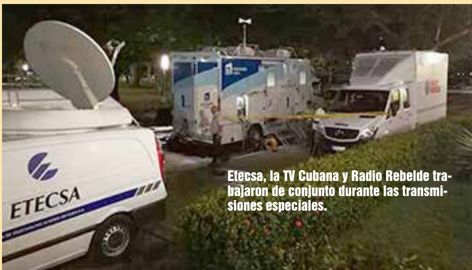
Etecsa, la TV Cubana y Radio Rebelde trabajaron de conjunto durante las transmisiones especiales.