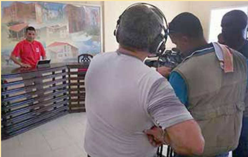
Desde Granma se transmitió una Mesa Redonda especial que evidenció los resultados de la provincia ganadora de la sede para celebrar el 26 de julio.