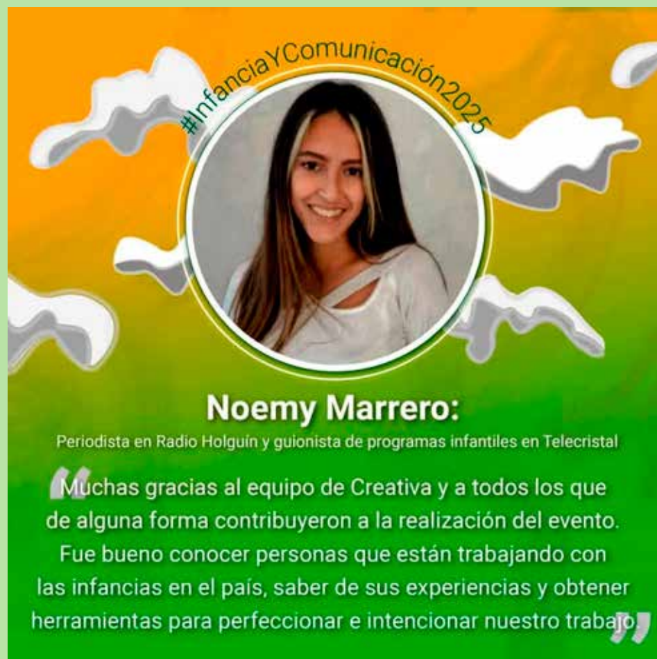
Reflexiones de algunos de los participantes del evento

–Si hablamos de aprendizajes, tendría que profundizar en varios aspectos. Pero creo que lo fundamental es que, al convocar a las personas para discutir temas realmente sensibles, que impactan el quehacer comunicacional en todas las esferas de la sociedad, hemos observado una participación entusiasta y comprometida en el desarrollo de la niñez y la